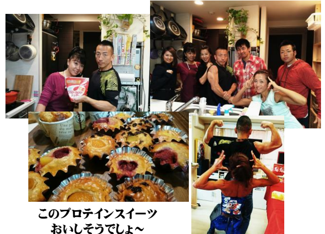
このプロテインスイーツ おいしそうでしょ～